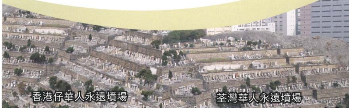
香港仔華人永遠墳場