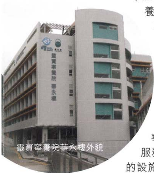
靈實寧養院華永樓外貌

華永會始創於香港，亦一直竭盡全力，服務香港市民，為市民提供多種高質素的設施及服務。香港寸金尺土，墓園用地越來越少，就着政府因應香港市民的需求而作出的安排，華永會將作出相應的配合，開展更多的服務。